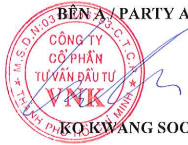
KO KWANG SOO