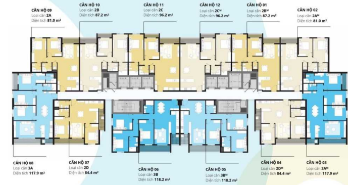
Mặt bằng tầng điển hình / Typical floor plan

Diện tích thông thủy trong bản vẽ là tương đối, thông số chính thức của từng căn hộ sẽ được quy định tại văn bản kỹ thuật giữa Chủ Đầu tư và Khách hàng. Usable area in the drawing is relative, the official parameters of each apartment shall be specified in the documents signed between Developer and Client.