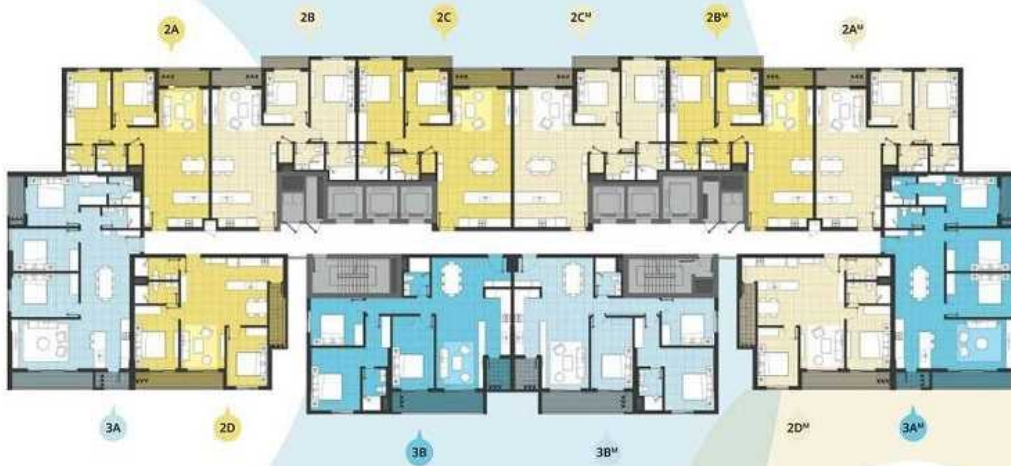
Mặt bằng tầng điển hình / Typical floor plan