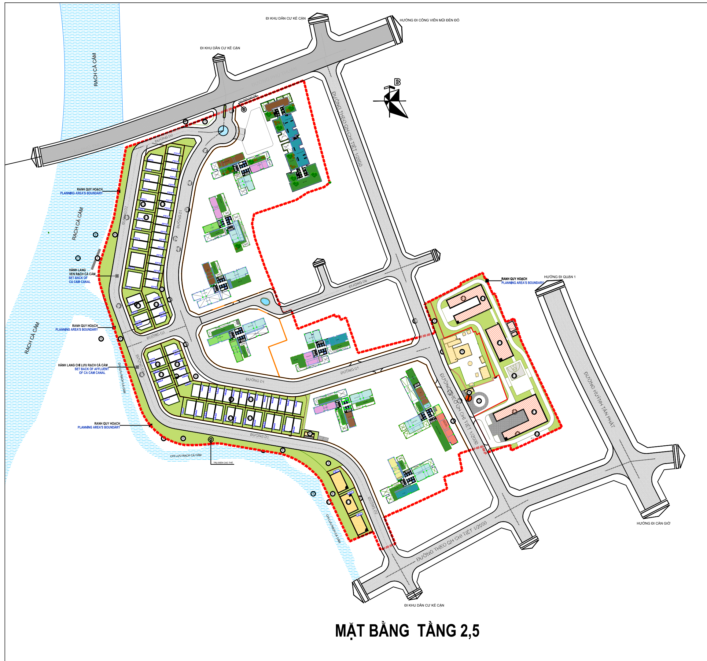
MẶT BẰNG TẦNG 2,5