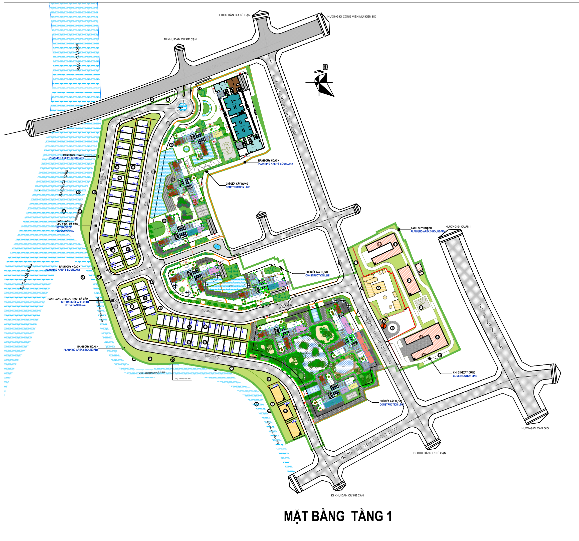
MẶT BẰNG TẦNG 1