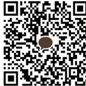
Jolie Le ID: minbep94