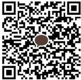
Angelo Yang ID: anhangyelo