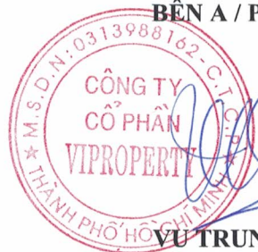
VU TRUNG KIEN