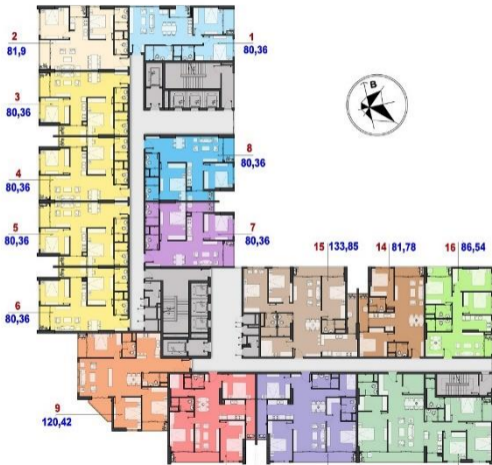
Floor Plan Floor 03 - 22