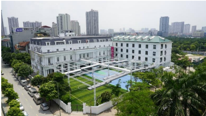
Archimedes Academy Primary School