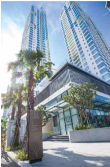
GATEWAY THAO DIEN 436 apartments Handover in 2018