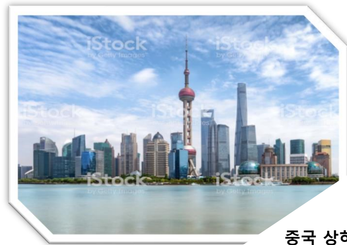
중국 상하이 Pudong Lujiazui