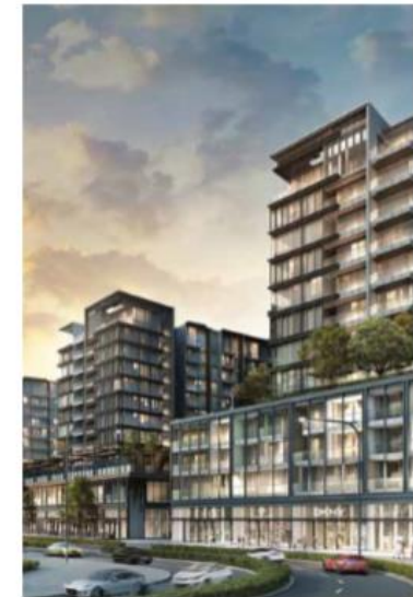
THE METROPOLE THU THIEM THE GALLERIA RESIDENCES (P1) 486 apartments & shops Under construction