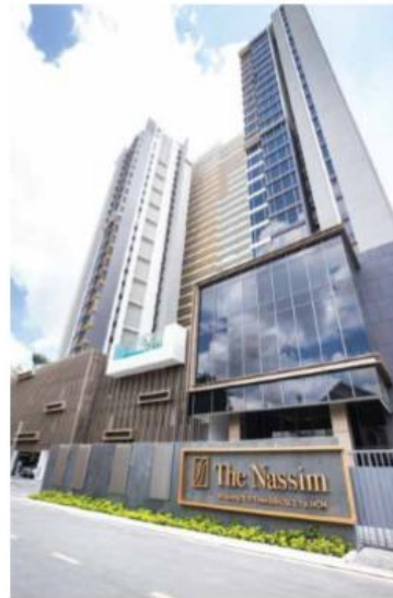
THE NASSIM 238 apartments Handover in 2018