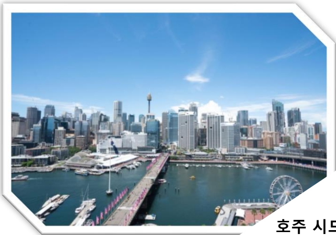
호주 시드니 Darling Harbour