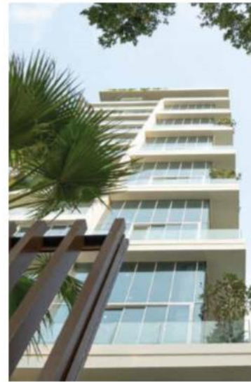
SERENITY SKY VILLAS 45 sky villas To be handed over by Mar 19