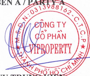
VU TRUNG KIEN