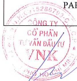
KO KWANG SOO