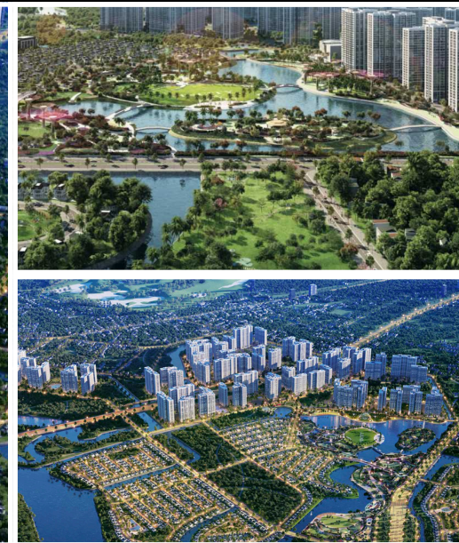
The Origami - S9.02, 20-13