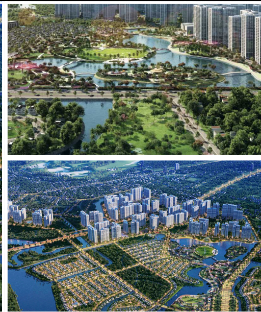
The Origami - S9.02, 12-13