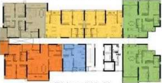
T4 Level 10, 16 Tháp 4 tầng 10, 16