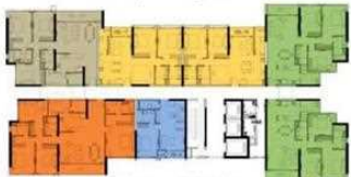
T4 Level 17, 19 Tháp 4 tầng 17, 19