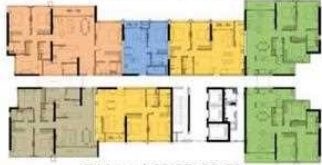
T4 Level 25-27, 29-33 Tháp 4 tầng 25-27, 29-33