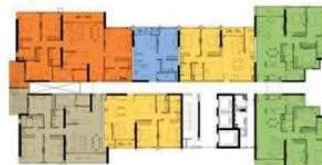
T4 Level 28 Tháp 4 tầng Level 28