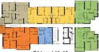
T4 Level 10, 16 Tháp 4 tầng 10, 16