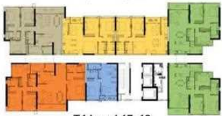
T4 Level 17, 19 Tháp 4 tầng 17, 19