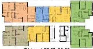
T4 Level 25-27, 29-33 Tháp 4 tầng 25-27, 29-33