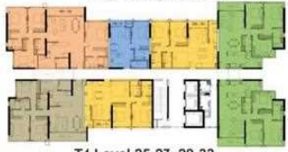
T4 Level 25-27, 29-33 Tháp 4 tầng 25-27, 29-33