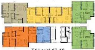
T4 Level 17, 19 Tháp 4 tầng 17, 19