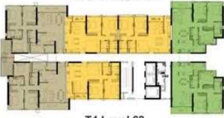
T4 Level 22 Tháp 4 tầng 22