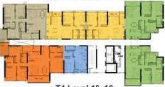
T4 Level 10, 16 Tháp 4 tầng 10, 16