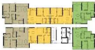
T4 Level 20-21 Tháp 4 tầng 20-21