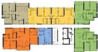
T4 Level 7-9, 11-15 Tháp 4 tầng 7-9, 11-15