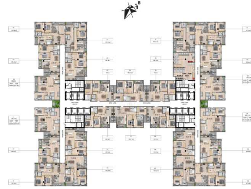
MẶT BẰNG TẦNG 30