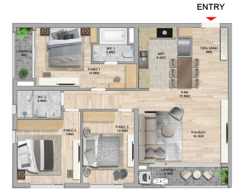
MẶT BẰNG CĂN HỘ A.N.03