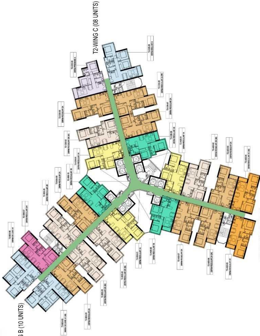
TYPICAL BLOCK PLAN TOWER 2 TOTAL UNITS: 26=1455 M2 (LL)