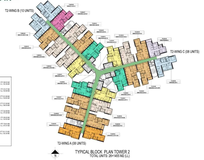
TYPICAL BLOCK PLAN TOWER 2 TOTAL UNITS: 26=1455 M2 (LL)