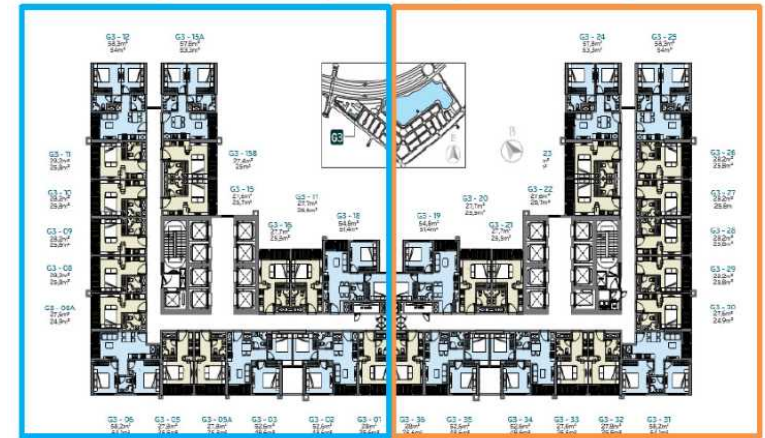
Mặt Bằng Tòa G3 Vinhomes Green Bay