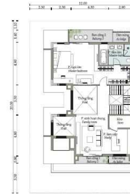
Mặt bằng tầng 2 Second floor plan