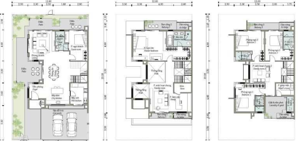
Mặt bằng tầng 1 First floor plan