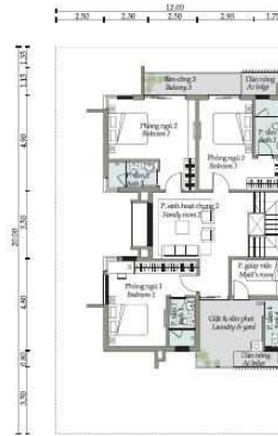
Mặt bằng tầng 3 Third floor plan