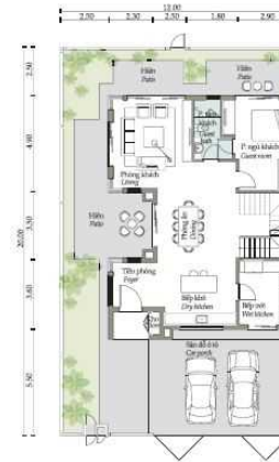
Mặt bằng tầng 1 First floor plan